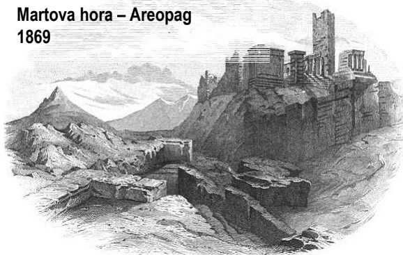
Martova hora – Areopag 1869

tomu, kdo se ptá, On odpoví: Jsi můj syn, jsi moje dcera. Stojím za tebou, když budeš cítit, že padáš, stačí se opřít. Jdu vedle tebe, když nebudeš vědět kudy, chytň se a já tě povedu. Věř mi, nejsem daleko.“ To, že Bůh chce mít účast na našem životě, chce být s námi, že jeho láska k nám je bezpodmínečná, může vést k tomu, že ho odmítneme (ze strachu?) jako někteří v Athénách. Ti však, kdo opravdu naslouchali, uvěřili. Mezi nimi člen Areopagu Diviš, pak žena, která se jmenovala Damaris a mnozí jiní. (Sk 17, 34)